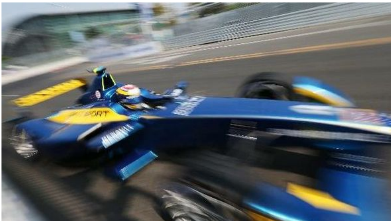
F.Renault: Peccenini show a Magny-Cours