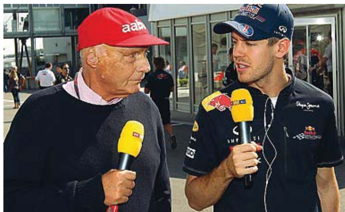
Niki Lauda, 65 anni con, Sebastian Vettel, 27: 7 titoli iridati in due. Tre per Niki 4 per Sebastian

«Non c'è alcuna necessità di cambiare i piloti» Il summit con Montezemolo di scena a... Capri